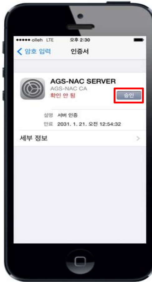
6. 인증서 확인(승인확인)