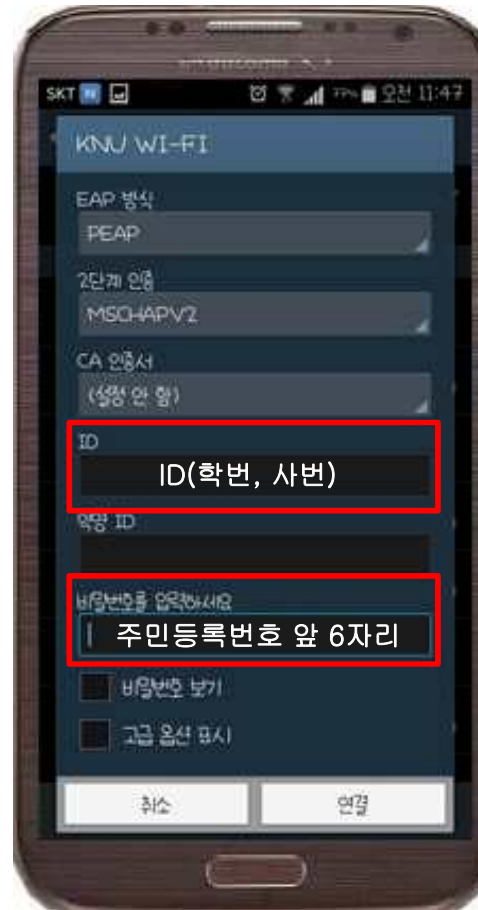
5. ID, 비밀번호 입력