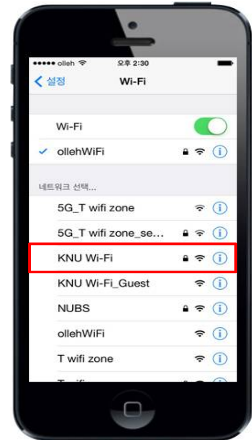
3. KNU Wi-Fi선택