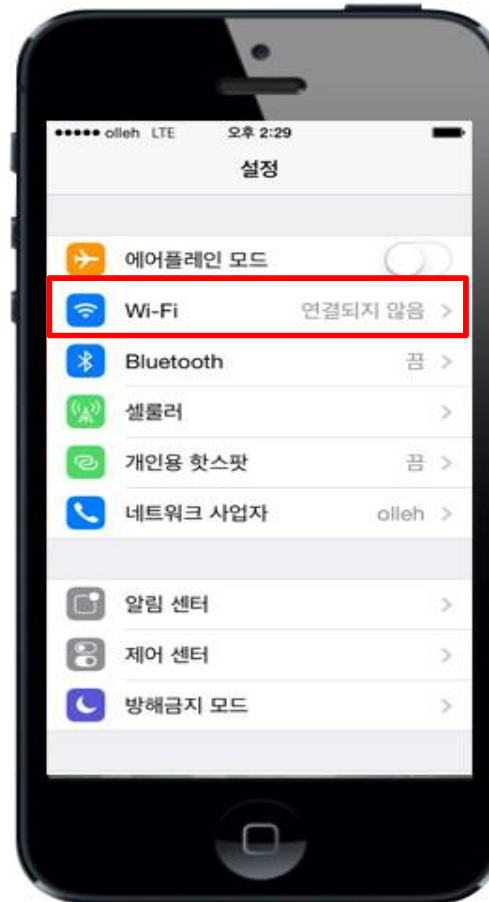
2. Wi-Fi 선택