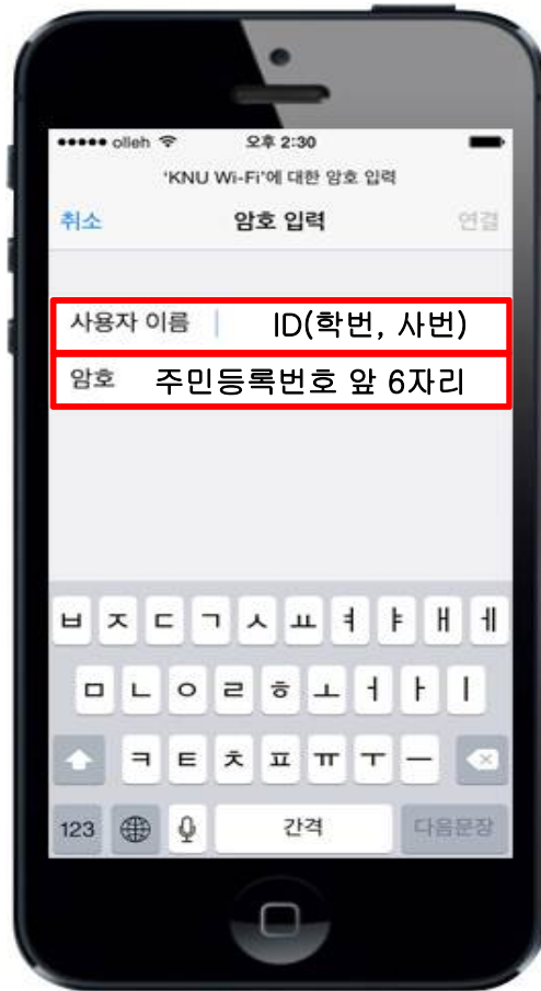
5. ID,패스워드 입력