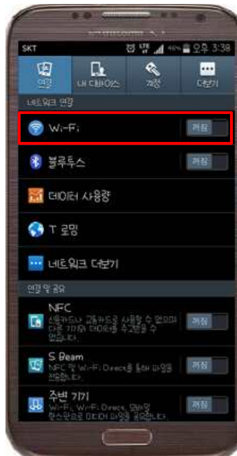
2. Wi-Fi 켜짐