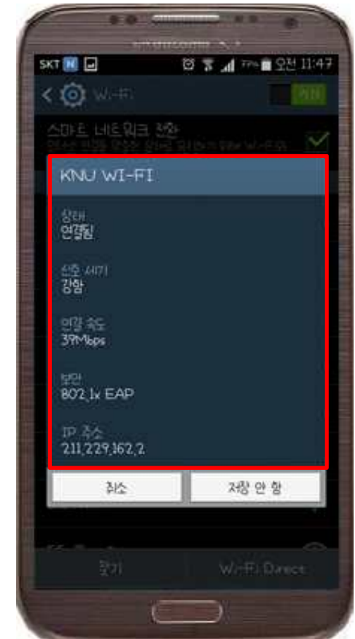
6. KNU 연결 상태 확인