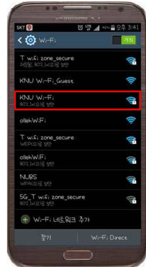
3. KNU Wi-Fi 선택