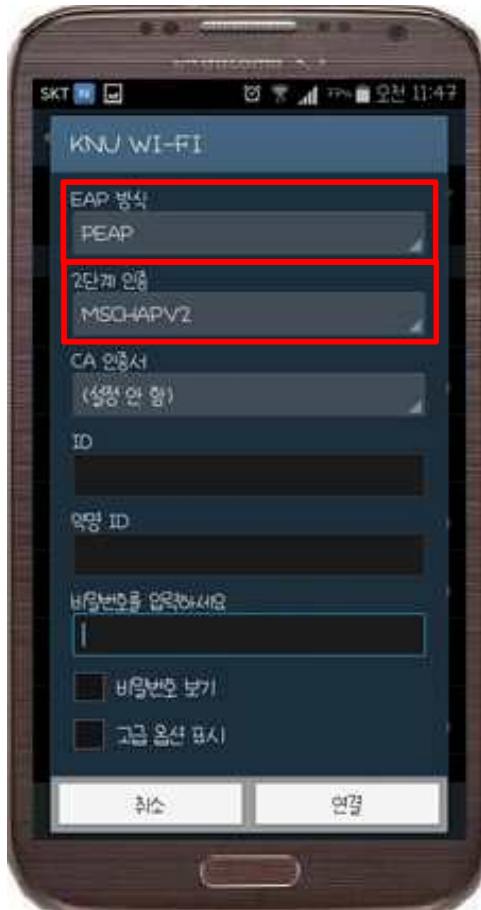
4. EAP 방식, 2단계 인증 변경 확인